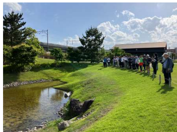
現地検討会で訪問した大友氏館跡庭園

また、韓国庭園デザイン学会の皆様への参加により、国際的な視点から日本庭園を見直すきっかけにもなりました。今後、国際連携が一層進み、文化財庭園の保存と活用に関する研究が発展していくことを期待しています。そして、庭園の歴史的・文化的意義がより広く認識され、次世代へ継承されることを心より願っております。大会関係者の皆様、このたびは貴重な機会を誠にありがとうございました。