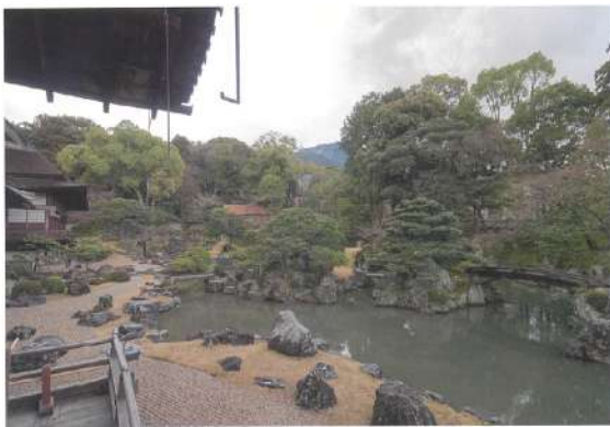
写真上下とも醍醐寺三宝院庭園

いずれも『特別史跡及び特別名勝 醍醐寺三宝院庭園保存修理事業報告書II(植栽・築山・茶室編)』宗教法人醍醐寺,平成26年より