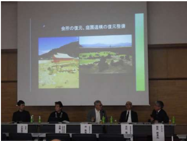
公開シンポジウム ディスカッションの様子