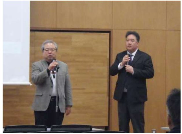
韓国庭園デザイン学会前会長 洪先生ご挨拶