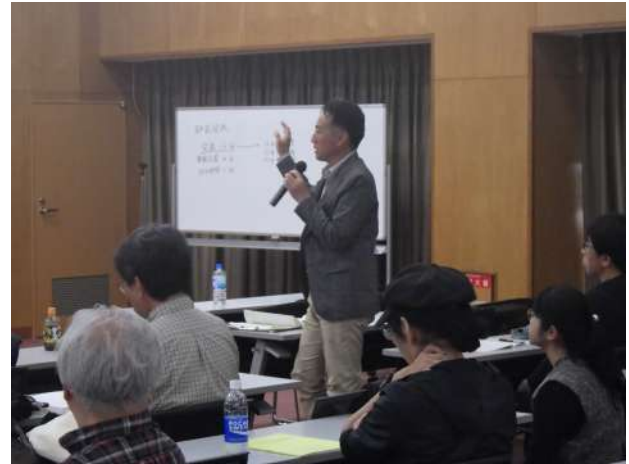
公開シンポジウム コメントの様子